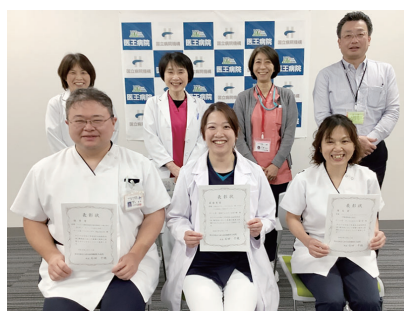
令和7年度QC活動 受賞者と特別審査員