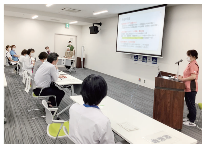
QC活動報告会 発表及び審査中

当院の受賞テーマは東海北陸グループのQC活動報告会にもエントリーし、東海北陸グループ管内全施設の職員からの投票と審査員審査を受けます。昨年度は当院栄養科の手作りデザートがグループ最優秀賞でした。今年も3つの表彰された演題から、さらにグループ内でも好評価を受けられることを期待しています。