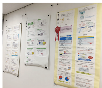
QC活動報告 掲示の様子