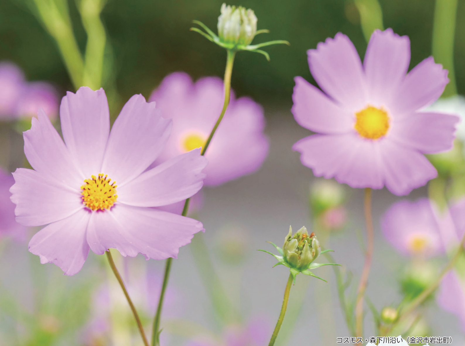
コスモス・森下川沿い（金沢市岩出町）

患者さん一人ひとりに寄り添い、心のふれあいを大切にし信頼される医療を目指します。