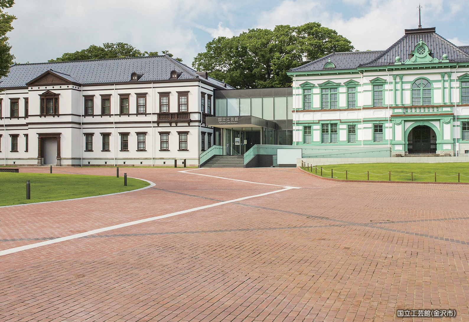
国立工芸館(金沢市)

患者さん一人ひとりに寄り添い、心のふれあいを大切にし信頼される医療を目指します。