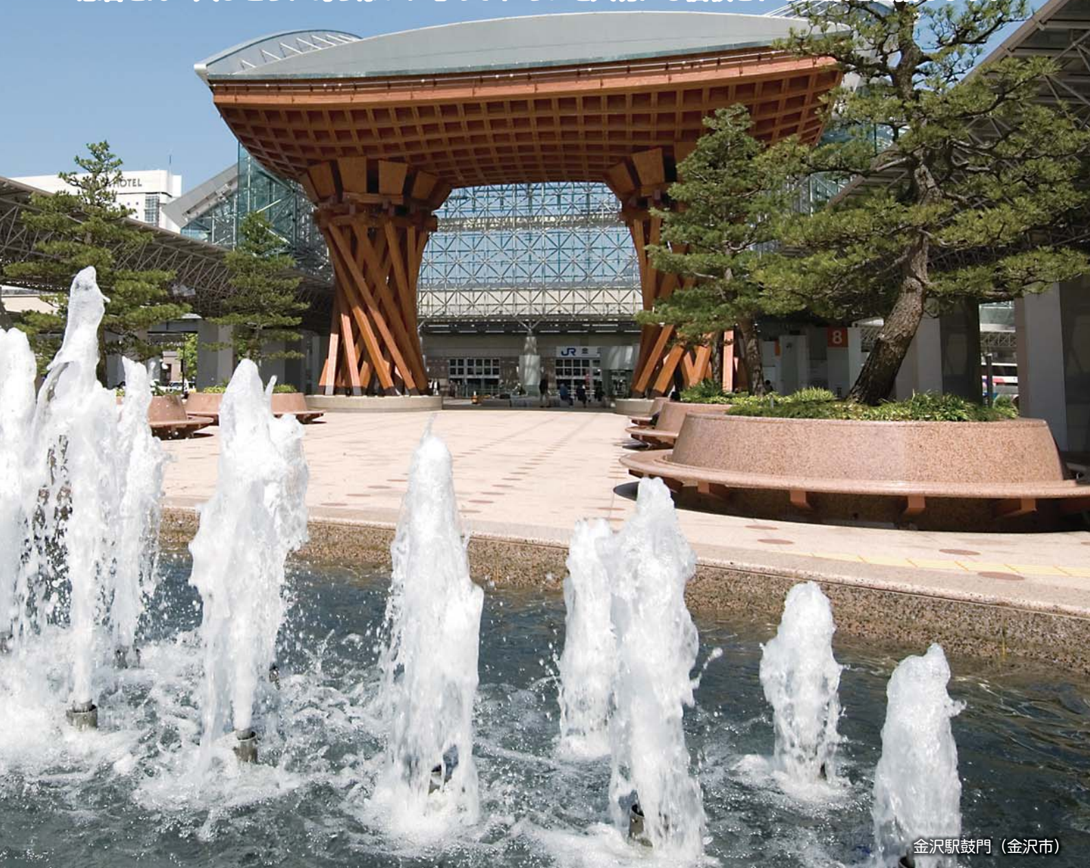
金沢駅鼓門（金沢市）

患者さん一人ひとりに寄り添い、心のふれあいを大切にし信頼される医療を目指します。